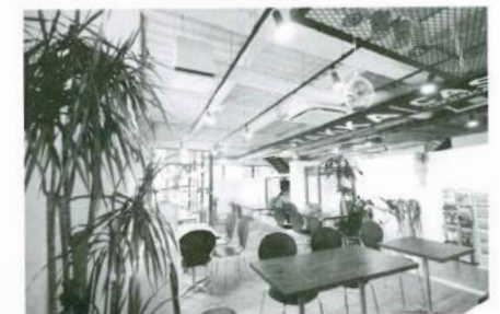
接客とともに消費者意識を満足させるスタイリッシュなカフェスペース

また、弊社では“おもてなし”を重視しており、デイサービスのご利用者が来所の際に「お待ちしております」、個別リハビリ終了後は「ありがとうございました」などの声かけを徹底しています。施設に「お世話になっている」という感覚ではなく、自分が「お金を払って利用している」という意識を強めることで“消費者”という役割をつくり出しているのです。通常であれば、利用者の消費者意識を高めることでのクレーム増加を懸念するでしょうが、弊社独自のマニュアル教育の徹底により、その懸念材料は払拭でき、人の予想を上回った戦略が取れるのです。