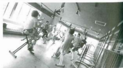
流行をとらえたさまざまな機器を導入したトレーニングスペース