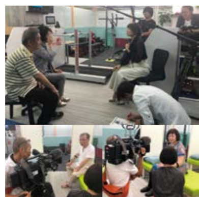
▲▶テレビの取材を受けられるご利用者様。

脳梗塞リハビリセンター自体も9月で5周年を迎え、人気の初回体験が無料となり、また、これまでご要望が多かったプラン料金の支払い方法について、分割払いが可能となりました。これを機に多くの皆様に弊社サービスを届けてまいりたいと思っておりますので、まずはお悩みなどをお気軽にお問い合わせください。